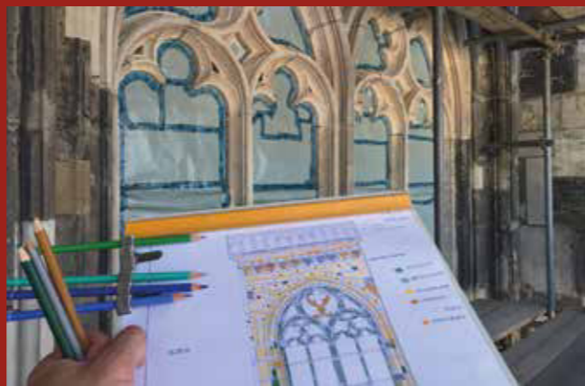
Aachen, Dom, Kartskapelle