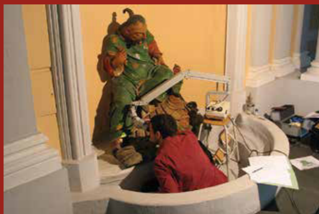
Brühl, Schloss Augustusburg

Tagungsgebühr: 70,00 €, für Studierende 35,00 € (inklusive Mittagsimbiss).