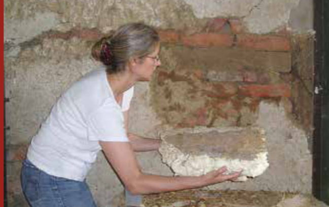
Titz-Rödingen, Synagoge

50679 Köln, Tel 0221 8275-2849, www.th-koeln.de/denkmalpflege